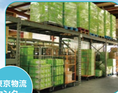
東京物流 センター