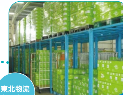
東北物流 センター