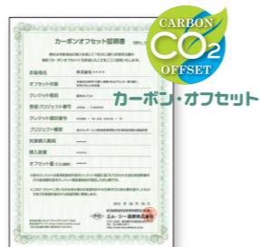
カーボンオフセット証明書

東北に工場を持ち被災もした弊社だからこそ、もっと被災地のお役に立ちたい。その思いから生まれ、被災地復興支援も出来ることから取組み始めました。MCTトナーの排出権(国内クレジット)でお客様がレーザープリンターご使用時に排出されるCO2をオフセットいたします。弊社の取り扱う排出権は東北被災地の企業によるCO2削減プロジェクトで削減できましたCO2を国内クレジット制度で購入しております。